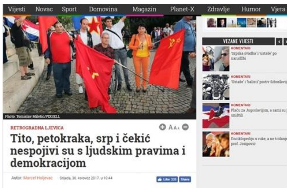
Slika 9: Tito, petokraka, srp i čekić

Autor teksta „Tito, petokraka, srp i čekić nespojivi su s ljudskim pravima i demokracijom“ navodi kako su se na antifašističkom prosvjedu održanom u kolovozu na Trgu žrtava fašizma našli „Ekstremna ljevica, neokomunisti, komunisti kao takvi, neke udruge Srba i Židova, te feministice i gay udruge koje se petljaju u nešto što ih se ne tiče i time gube kredibilitet i smisao postojanja.“, diskriminirajući pritom sve navedene skupine. Izreći da bilo