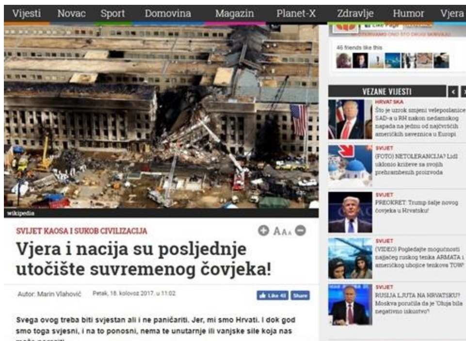
Slika 13: Vjera i nacija su posljednje utočište suvremenog čovjeka!

Veličanje vjere i domoljublja nije ono što je problematično ili sporno u ovom tekstu, već ranije upotrebljeni naziv „parazit“ (v. Slika 6 ) „Visok postotak vjernika, snažna uloga Crkve i jaka te glasna domoljubna Hrvatska koja je stasala i izgradila se na temeljima domovinskog i oslobodilačkog rata. To su jedina prava jamstva našeg opstanka. Ipak, ono što nas treba zabrinuti jest prodor parazita i socijalističkog taloga u sve strukture države.“, autor socijaldemokrate i očito sve koji nisu zagovornici istih životnih načela kao on, naziva „parazitima“ i upozorava čitatelje da ih „protivnici žele poraziti“ (v. Slika 13 )