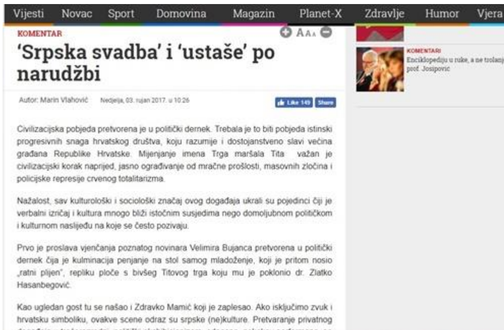
Slika 1: „Srpska svadba“ i „ustaše“ po narudžbi

Već sam naslov ovog komentara i kontekst u kojem je upotrebljen izraz „srpska svadba“ i „ustaše“ aludira na diskriminaciju. Trenutno aktualno mijenjanje ulične ploče Trga maršala Tita glavna je tema većine tekstova zadnjih nekoliko dana na portalu Dnevno.hr. Komentar da je taj potez „civilizacijski korak naprijed“ i „ograđivanje od policijske represije crvenog totalitarizma“ jasan je primjer netolerantnog govora davajući pritom aluziju da je društvo do sada bilo necivilizirano jer je imalo naziv trga po predsjedniku nekadašnje Jugoslavije. U nastavku teksta, autor navodi kako su scene slavlja i plesa svadbe, „ako isključimo zvuk i hrvatsku simboliku, odraz srpske (ne)kulture“, zapravo divljaštvo navodi kao karakteristiku srpske (ne)kulture. Iako bi u komentaru, kao novinarskom žanru, trebalo analitički objasniti tezu iza koje autor stoji, u ovom slučaju su samo nabrojane