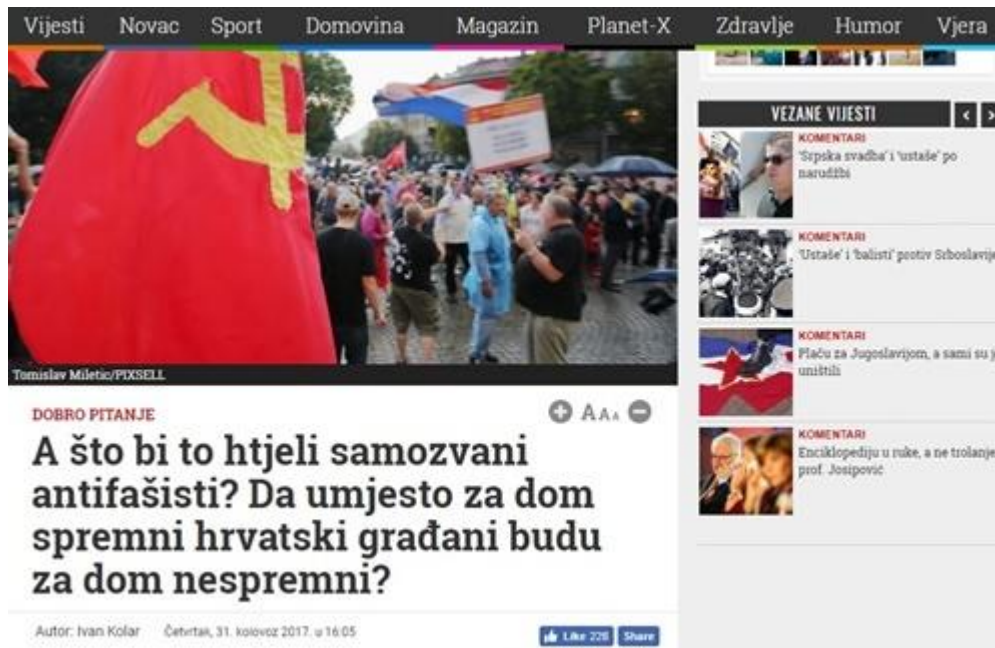
Slika 8: Za dom spremni!

Iznad naslova teksta „A što bi to htjeli samozvani antifasisti? Da umjesto za dom spremni hrvatski građani budu za dom nesprenni?“, nalazi se nadnaslov „Dobro pitanje.“, kojim se opravdava i potiče kontroverzni ustaški pozdrav i vojni poklič „Za dom spremni“. On se smatra ekvivalentom nacističkog „Sieg Heil“ pokliča koji je u Njemačkoj kažnjiv zakonom. Iako u hrvatskom pravnom sustavu poklič „Za dom spremni“ je kažnjiv po nekoliko prekršajnih zakona: Zakonu o javnom redu i miru, Zakon o javnom okupljanju, Zakon o sprečavanju nereda na sportskim natjecanjima ili Zakonu o suzbijanju diskriminacije, portal Dnevno.hr podržava i potiče taj poklič, te se umanjuje njegova poveznica s NDH i njenom rasističkom ideologijom i postupanjima. Porast ovakve ikonografije trebao bi biti sankcioniran i Kaznenim zakonom iz 2013.godine gdje je navedeno „Tko putem tiska, radija,