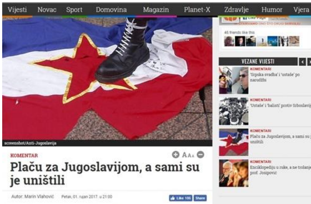
Slika 6: Plaču za Jugoslavijom, a sami su ju uništili

Ilustracija gaženja Jugoslavenske zastave već je sama po sebi kažnjiva Kaznenim zakonom. čl. 356. st.1. navodi „Tko javno izvrgne ruglu, preziru ili grubom omalovažavanju stranu državu, njezinu zastavu, grb, himnu, kaznit će se kaznom zatvora do jedne godine.“ (Kazneni zakon, čl.356., st. 1). Iako portal Dnevno.hr nije taj koji je izvršio sam čin gaženja zastave, kontekst ovog komentara pokazuje diskriminacijski govor. Autor navodi „Taj golemi parazit sastavljen od stotine tisuća ljudi profila Josipovića, Mesića i ostalih zasjeo je na čelne pozicije u tvornicama, poljoprivrednim kombinatima, Sveučilištima i općenito partiji.“, nazivajući pritom političare sklone „lijevici“ – „parazitima“.