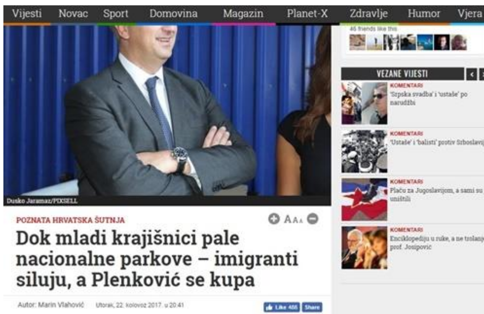
Slika 10: Dok mladi krajišnici pale nacionalne parkove- imigranti siluju, a Plenković se kupa

Naslov teksta „Dok mladi krajišnici pale nacionalne parkove- imigranti siluju, a Plenković se kupa“, diskriminira na nekoliko osnova. Prije svega, autor teksta proziva navodne podmetače požara koji su rodom iz Republike Srbije i naziva ih „krajišnicima“.