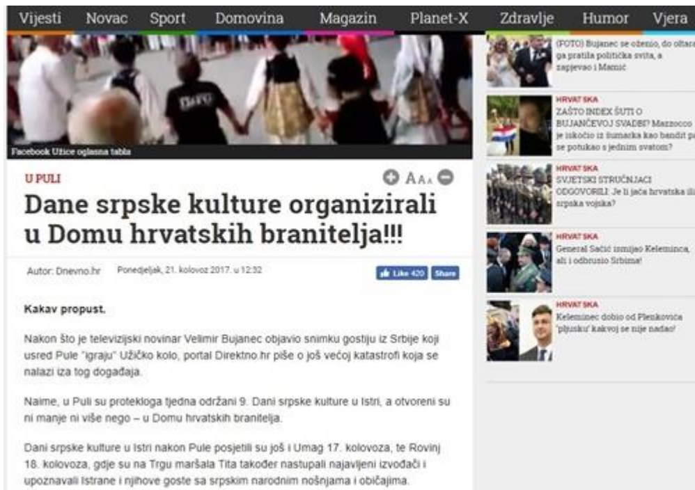
Slika 12: Dani srpske kulture

Ovaj netolerantni tekst pod naslovom „Dane srpske kulture organizirali u Domu hrvatskih branitelja!!!“, počinje riječima „Kakav propust.“. Naglašavanjem interpunkcijskih znakova na kraju naslova, Dnevno.hr aludira na skandaloznu vijest, a početkom teksta izjašnjava svoj stav prema srpskoj nacionalnoj manjini nazivajući Dane srpske kulture u Istri „katastrofom“. Srpska nacionalna manjina, kao uostalom i sve druge manjine imaju pravo na održavanje svojih tradicija i događaja određene Ustavnim zakonom o pravima nacionalnih manjina: „Republika Hrvatska osigurava ostvarivanje posebnih prava i sloboda pripadnika nacionalnih manjina koja oni uživaju pojedinačno ili zajedno s drugim osobama koje pripadaju istoj nacionalnoj manjini, a kada je to određeno ovim Ustavnim zakonom ili posebnim zakonom, zajedno s pripadnicima drugih nacionalnih manjina, naročito: 1. Služenje svojim jezikom i pismom, privatno i u javnoj upotrebi, te u službenoj upotrebi; 2. Odgoj i obrazovanje na jeziku i pismu s kojim se služe; 3. Uporabu svojih znamenja i simbola; 4. Kulturna autonomija održavanje, razvojem i iskazivanjem vlastite kulture, te očivanja i zaštite