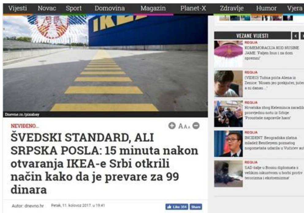
Slika 14: Švedski standard, ali srpska posla

Naslov „Švedski standard, ali srpska posla: 15 minuta nakon otvaranja IKEA-e Srbi otkrili način kako da je prevare za 99 dinara“, iskazuje netoleranciju i diskriminaciju prema Srbima indirektno ih nazivajući (cijelu naciju) – lopovima. Izraz „srpska posla“ u ovom kontekstu tumači ih kao lopove i kao da je to dio identiteta svakog Srbina. Od male vijesti, koja bi trebala biti informativnog sadržaja, Dnevno.hr još je jednom „stavio u isti koš“ i diskriminirao Srbe. (v. Slika 14 )