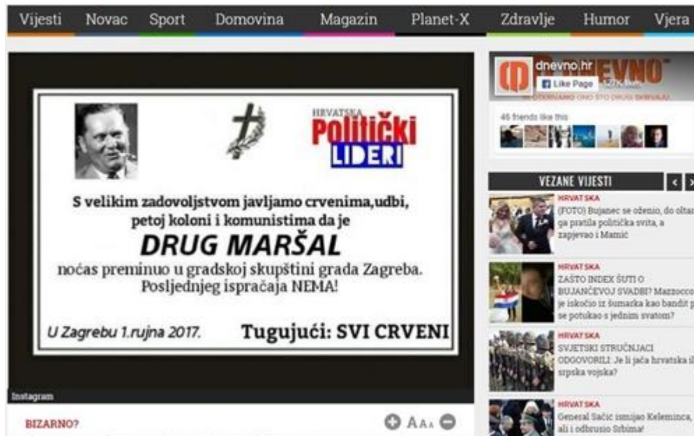
Slika 2: Osmrtnica Josipu brozu Titu

Ilustracija osmrtnice nakon odluke zagrebačke Gradske skupštine o promjeni imena Trga maršala Tita u Trg Republike Hrvatske. Iako je ilustraciju izvorno napravila mladež HDZ-a grada Zadra, portal Dnevno.hr stavio ju je na naslovnicu i prenio kao svoju i tek kasnije u tekstu naveo da ju je izradila mladež HDZ-a. Ovo je primjer vrlo očitog govora mržnje, davajući pritom svim lijevičarima etiketu „crvenih“, a Dnevno.hr u tekstu navodi da je ovo „zanimljiva“ reakcija na promjenu imena trga, pritom subliminalno potičajući korisnike na diskriminaciju. (v. Slika 2)