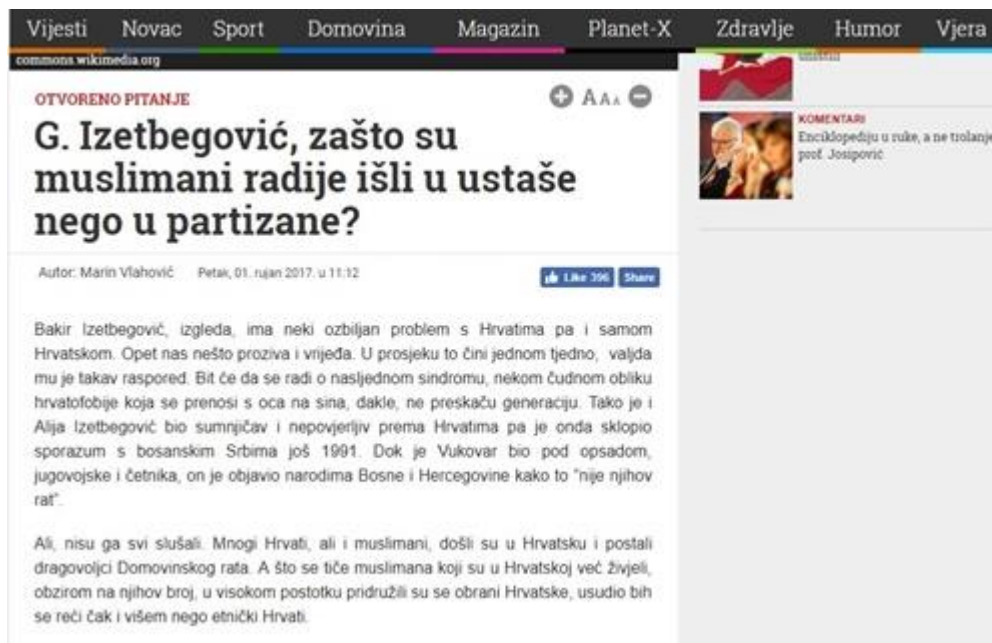
Slika 7: Zašto su muslimani radije išli u ustaše nego u partizane?

Autor u tekstu govori kako Bakir Izetbegović „boluje“ od „hrvatofobije“. Ne iznenađuje činjenica da tekstovi koji se nalaze na portalu Dnevno.hr imaju neutralan stav o Muslimanima (v. Tablica 1 ), jer očito i autor ovog teksta sud o nekom donosi na temelju zbivanja u ratno doba i tome tko je koju stranu izabrao. Muslimani su izabrali radije se prikloniti „ustašama“ nego „partizanima“, pa se o njima ne piše u negativnom kontekstu.