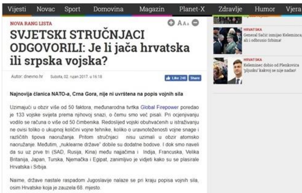
Slika 3: Je li jača hrvatska ili srpska vojska?

Pročitati naslov ovog teksta prikazuje „vječnu borbu“ između Srba i Hrvata. Možemo ga okarakterizirati kao nacionalistički i mržnjački naslov ako uzmemo u obzir da tekst daje uvid u listu 133 vojske svijeta prema njihovoj snazi, a ne samo srpsku i hrvatsku. Provedeno je istraživanje međunarodne tvrtke Global Firepower koja je poredala 133 vojske svijeta prema njihovoj snazi, ali portal Dnevno.hr odlučio je istaknuti i usporediti samo ove dvije, hrvatsku i srpsku, oko kojih se još i danas u 2017.godini, raspravlja u kontekstu nacija i rata. (v. Slika 3)