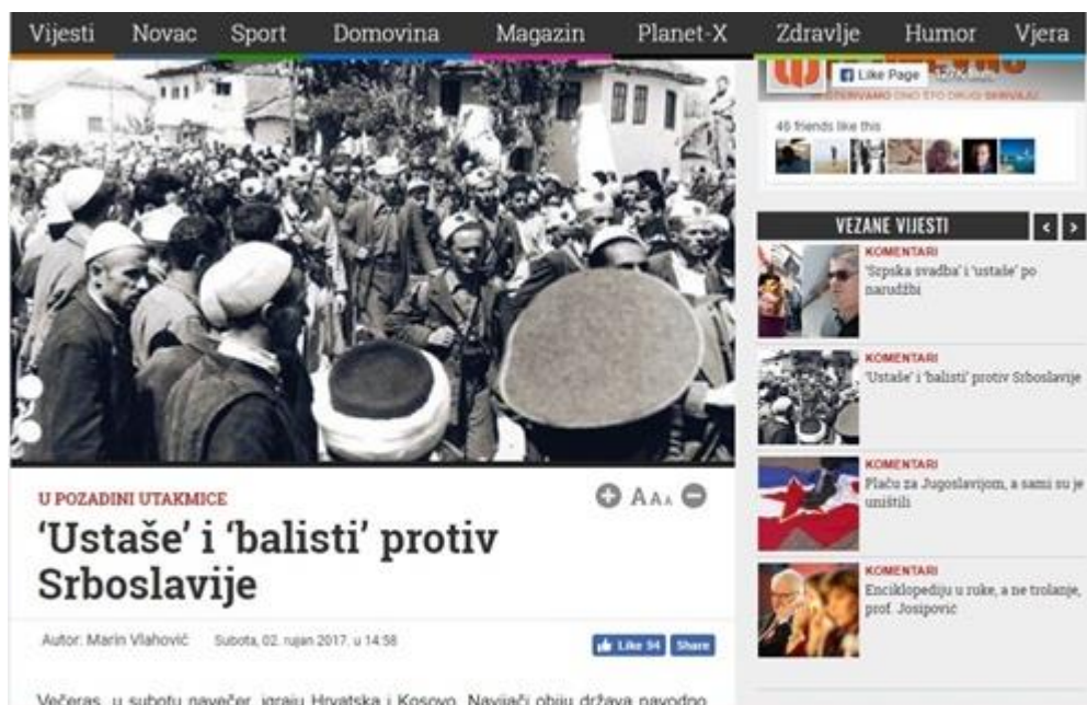
Slika 4: „Ustaše“ i „balisti“ protiv Srboslavije

Ako uzmemo u obzir kontekst i da se iza nogometne utakmice između Hrvatske i Kosova u ovom slučaju uzeo i povijesni i politički kontekst obje države, naslov je itekako diskriminacijski. Autor u tekstu navodi povijesne situacije spominjajući projekt „Velike Srbije“ kao „višestoljetni zločinački projekt“. Također, navodi: „Kad nas vide na terenu oni koji nisu prestali sanjati Veliku Srbiju, mogu samo komentirati, gle ustaše i balisti. Da, „ustaše“ i „balisti“ igrali su protiv „Srboslavije“ a kako je ta tekma završila, ne trebamo valjda ponavljati...“, aludirajući na rat, borbu, mržnju i ubijanje.