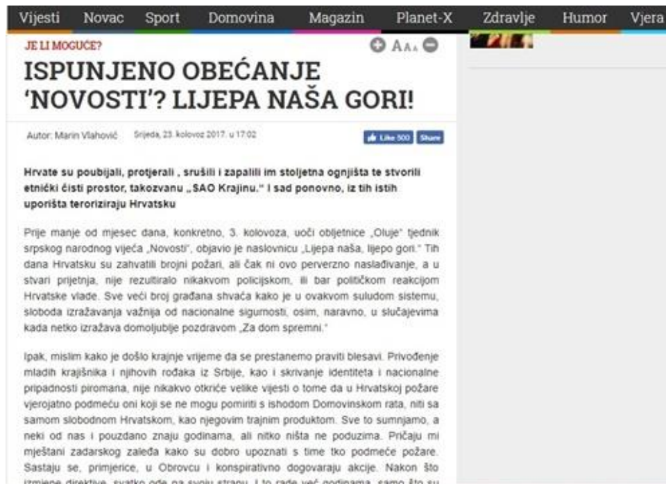
Slika 11: Lijepa naša gori!

Komentar autora na naslovnicu „Lijepa naša, lijepo gori“ tjednika srpskog narodnog vijeća „Novosti“, u najmanju je ruku diskriminatoran i netolerancijski. Ne umanjujući konotacije konkretnog tjednika i njegove naslovnice, autor proziva i krivi, bez konkretnih dokaza, „mlade krajišnike i njihove rođake iz Srbije“ za podmetanje požara. „Privođenje mladih krajišnika i njihovih rođaka iz Srbije, kao i skrivanje identiteta i nacionalne pripadnosti piromana, nije nikakvo otkriće velike vijesti o tome da u Hrvatskoj požare vjerojatno podmeću oni koji se ne mogu pomiriti s ishodom Domovinskog rata, niti sa samom slobodnom Hrvatskom, kao njegovim trajnim produktom.“, autor aludira da se podmetanje požara događa zbog ishoda Domovinskog rata. Zašto bi uostalom nacionalnos određenog piromana trebala biti poznata javnosti osim ako se ne želi potaknuti mržnja prema toj naciji? „Iza bešćutne satire i naslade nad tuđom tragedijom, krije se velikosrpska želja za osvetom.“, zaključio je autor. (v. Slika 11)