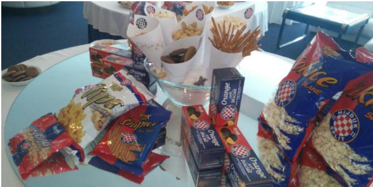
Slika 1: Hajduk Split grickalice – izvor: https://goo.gl/images/o4CbiC

Nogomet sam po sebi ne bi bio bitan, da nema navijača. Navijači se po mnogočemu razlikuju od pratitelja, zbog toga što funkcioniraju kao zasebna kulturološka cjelina. U Europi se navijačke skupine nazivaju i ultras 4 , što dolazi od latinskog ultra , a označava nadprosječni entuzijizam u ovom slučaju, po pitanju nogometa. Navijači su prepoznatljivi po svom fanatičnom pjevanju u velikim grupama, prkošenju autoritetima, te prikazivanju transparenta, napisa i banera na stadionima. To pridodaje atmosferi kojoj je cilj uplašiti navijače i igrače suparničkog tima, ali i poduprijeti vlastiti tim.