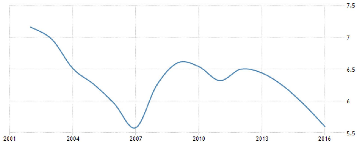
Tablica 1: Teroristički indeks: Kolumbija

učestalosti terorističkih djela. Vrhunac je tako bio 2002. godine kada je indeks iznosio 7,16 te je nakon toga uslijedio pad sve do 2007. godine. Nakon toga ponovno slijedi razdoblje uspona kada je indeks dosegao nešto više od 6,5 da bi nakon 2012. godine ponovno uslijedio pad (ibid). Posljednji se pad može povezati sa mirovnim pregovorima, budući da su oni započeli 2012. godine. Detaljnije se može vidjeti na grafikonu u nastavku.