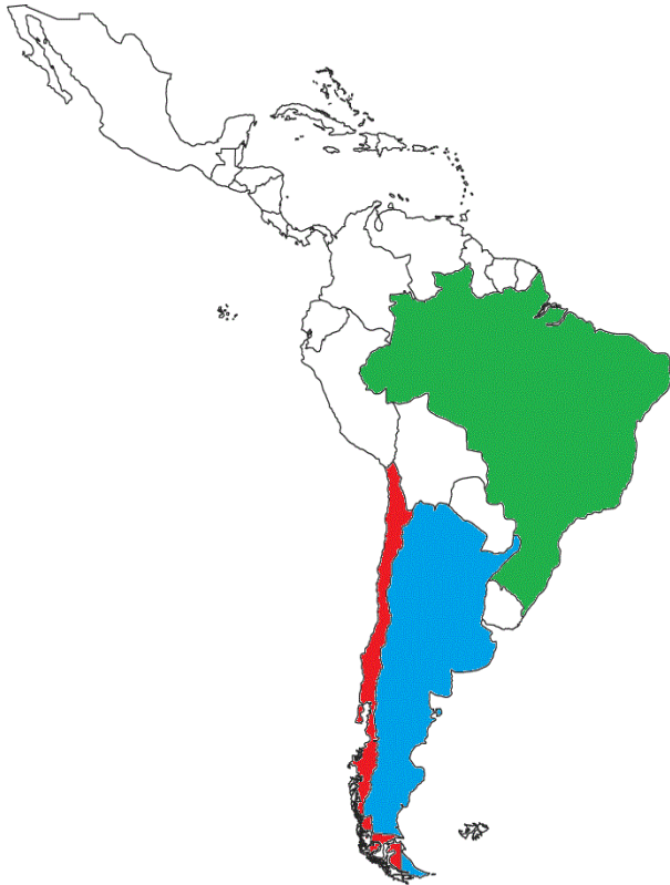
Karta 2: Latinskoameričke države s najvećim brojem hrvatskih doseljenika

Za početak slijedi kratak povijesni pregled doseljavanja Hrvata u tu regiju, nakon čega slijede primjeri uspješnih hrvatskih iseljenika u području politike i ekonomije u tri izabrane latinskoameričke države: Argentini, Čileu te Brazilu. U navedenim državama živi oko pola milijuna stanovnika koji svoje porijeklo vuku iz Hrvatske (Kos-Stanišić, 2010: 164). Karta 2 prikazuje navedene latinskoameričke države. 3 4