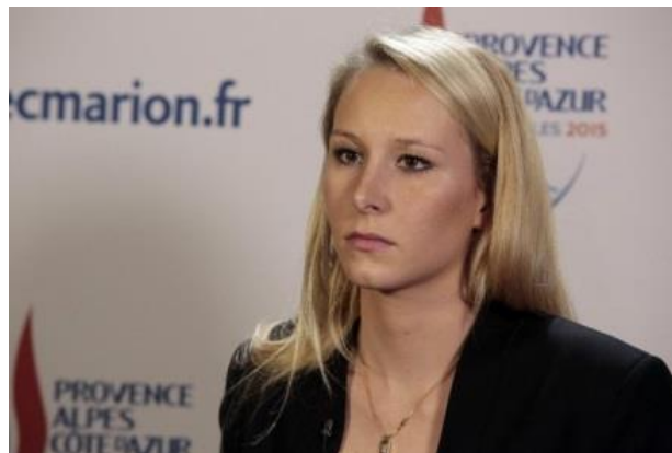
Slika 4. Marion Jeanne Caroline Maréchal-Le Pen