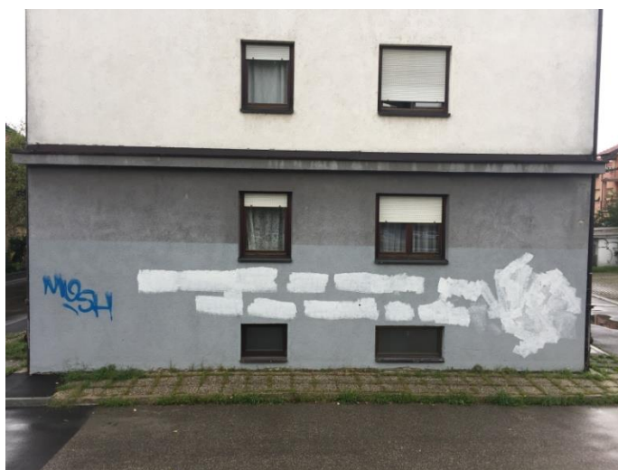
Slika 2 Isto mjesto 8.9.2017.

Natpisi su odmah istog dana bili prebrisani, međutim natpisi i simboli se ponovno pojave preko prefarbanih područja.