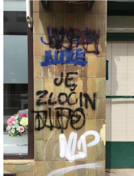
Slika 8 'JUGA NDH je zločin TITO', Izvor: autorica, 2017

Osim političkih i navijačkih poruka koje se mogu iščitati može se uočiti da se kroz cijelu ulicu vide primjeri grafita. Količinska dinamika grafita se izrazito smanjuje kada se kreće od smjera Ljubljance prema centru grada što možete iščitati na Karti 2 gdje su ulice podijeljene u četiri kategorije: Velik broj grafita označava više od 40 grafita, Manji broj grafita označava od 5 do 40 grafita, kategorija Skoro nema grafita označava količinu do 5 grafita te kategorija Nema grafita obilježava nepostojanje grafita na toj površini. Od Ljubljance do križanja sa Selskom ulicom natpisi su pretežito na lijevoj strani ulice. Kada se krene od Selske prema Nehajskoj količina grafita na desnoj strani drastično povećava dok se na lijevoj smanjuje jer na toj strani ima više poslovnica u stambenim zgradama. Od Nehajske ukupna se količina natpisa i tagova drastično smanjuje što je uglavnom područje Trešnjevačkog trga. Nakon toga kada Ozaljska pređe u Tratinsku ulicu natpisi, tagovi i grafiti se ponovno pojavljuju u malo većem broju na tramvajskoj stanici 'Badalićeva' te do kraja Tratinske ulice sve do Savske ceste, koja je dio šireg centra Zagreba, gotovo pa i nema nikakvih natpisa.