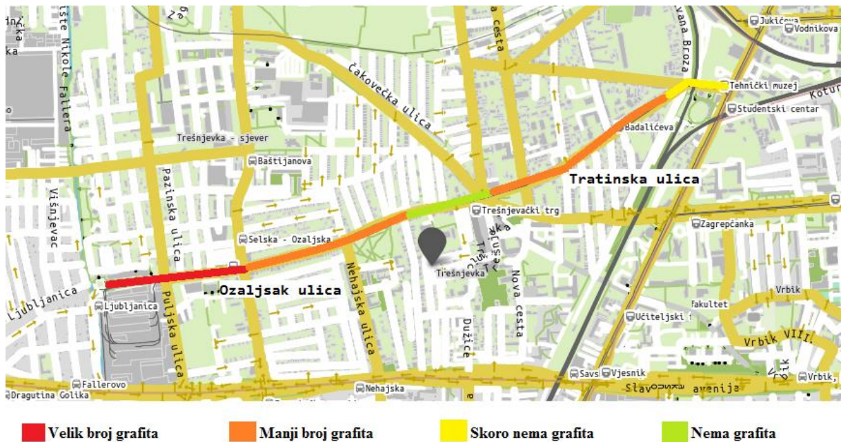
Karta 2. Dinamika grafita u Ozaljskoj i Tratinskoj ulici