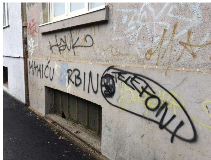
Slika 9 'MAMIĆU SRBINE', Izvor autorica, 2017