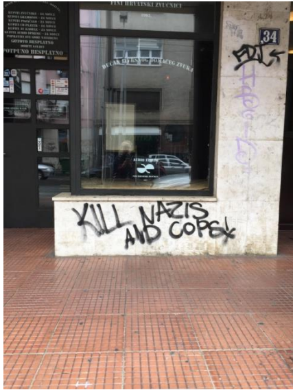
Slika 7 'Kill Nazis and cops!'