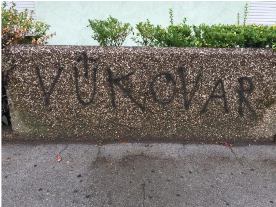
Slika 4 'Vukovar' sa ustaškim znakom, Izvor: autorica, 2017

Selskom ulicom najviše pojavljuju neonacistički natpisi a može se izbrojati 49 svastika od kojih su neke prebojane a neke tek napisane. U istom predjelu mogu se vidjeti natpisi 'Vukovar' u kombinaciji sa svastikama ili natpisi 'Za dom spremni'. Uz to mogu se pronaći i natpisi skinheada kao i natpis Bad Blue Boysa .