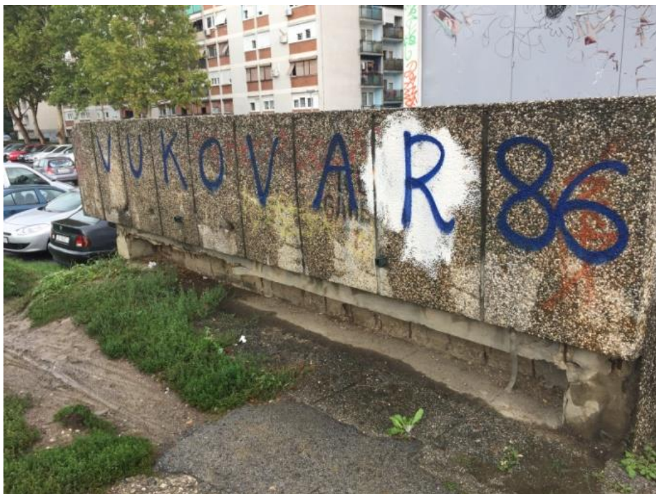
Slika 5 Natpis 'Vukovar 86' na Ljubljani, Izvor: autorica, 2017