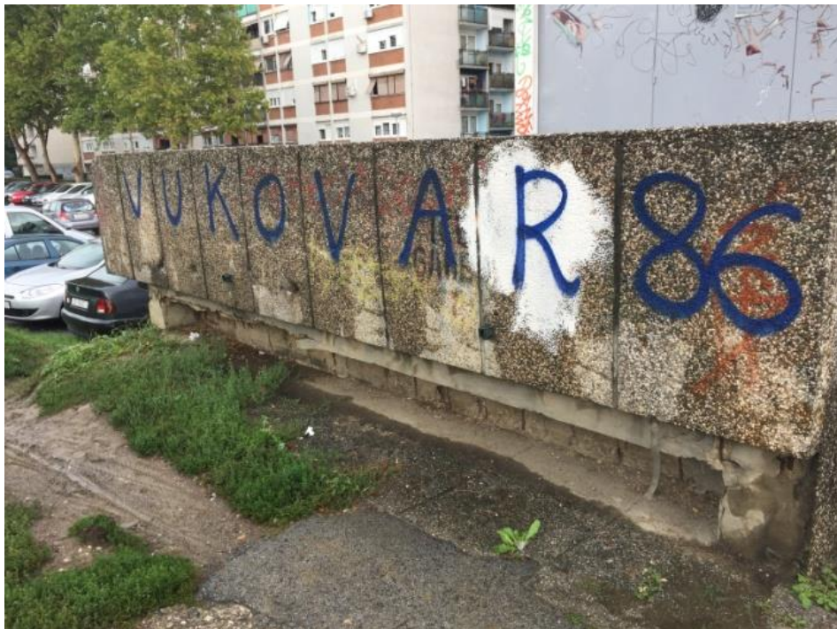
Slika 5 Natpis 'Vukovar 86' na Ljubljani, Izvor: autorica, 2017