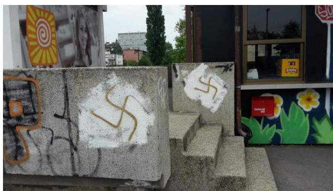
Slika 3 Twitter, Index 29.5.2016

Natpisi su odmah istog dana bili prebrisani, međutim natpisi i simboli se ponovno pojave preko prefarbanih područja.