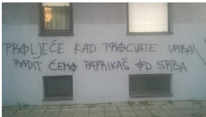
Slika 1 Twitter, Index 29.5.2016, Izvor: http://www.index.hr/vijesti/clanak/foto-novi-odvratni-grafiti-osvanuli-na-zagrebackoj-remizi/896322.aspx , 2016