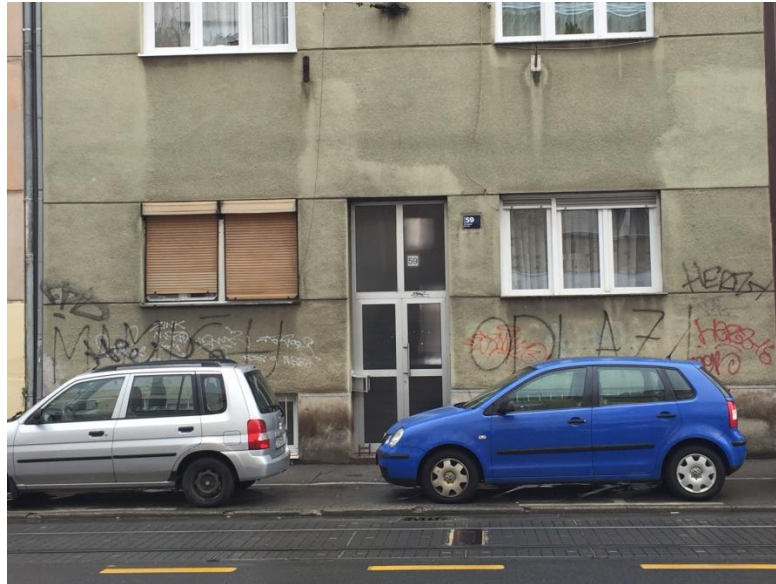
Slika 6 'MAMIĆU ODLAZI!', Izvor: autorica, 2017

Kada se krene dalje Ozaljskom ulicom nakon križanja sa Selskom dolazi do iznenadnog zatišja neonacističkih i ustaških obilježja koja se u velikom broju pojavljuju do te točke. Zidovi nastavljaju biti ispisani tagovima i grafitima raznih grafitera. Od Selske ulice pa sve do Trešnjevačkog trga pojavljuju se tagovi nogometnog kluba Dinamo te natpisi 'MAMIĆU ODLAZI!' i 'MAMIĆU SRBINE'.