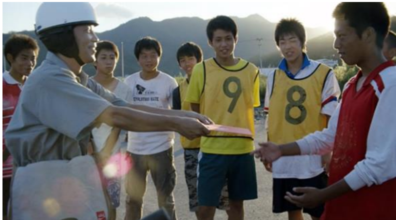
Slika 7: Pozivnica za FIFA World Cup

Uz Olimpijske Igre, Coca-Cola je ponosni sponzor FIFA World Cup, a to partnerstvo traje još od 1978. godine. Kompanija je oglašavala stadione na svakom Svjetskom prvenstvu od 1950. godine, a FIFA i Kompanija svoje partnerstvo su proširili na razdoblje do 2030. godine.