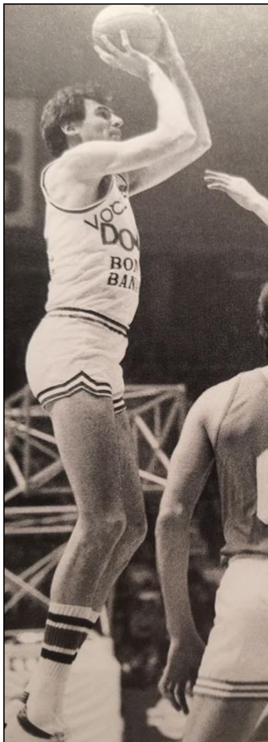
Slika 8: Krešimir Ćosić

Krešimir Ćosić primljen je u Kuću slavnih 1996. godine. Igrao je koledž košarku na Brigham Young University i ušao u All-Americanse . S reprezentacijom bivše države je 1968. osvojio srebrnu, a potom 1980. i zlatnu medalju Olimpijskim igrama. Sudjelovao je i na četiri svjetska prvenstva (na kojima je dva puta bio zlatni) te osam europskih (dva puta proglašen MVP-em). Igrao je, a zatim i trenirao Olimpiu i Cibonu osvojivši pet titula prvaka Jugoslavije. Krešimir Ćosić otvorio je igrom na BYU put drugim internacionalnim košarkašima da dođu usavršavati svoje košarkaško znanje u Ameriku (isto). Po njemu naziv nosi zadarska košarkaška dvorana na Višnjiku gdje KK Zadar i danas igra svoje utakmice.