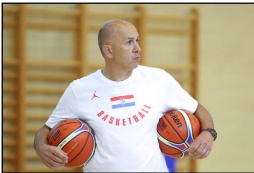
Slika 12: Dražen Anzulović

Dražen Anzulović rođen je u Zagrebu 7. svibnja 1967. godine. Hrvatski je košarkaški trener i bivši košarkaš. Do početka svibnja ove godine bio je izbornik hrvatske reprezentacije, a na tu je poziciju došao 27. travnja 2018. godine.