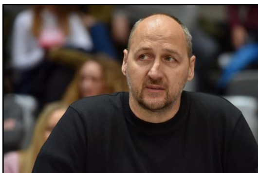
Slika 14: Dino Rađa

Dino Rađa rođen je u Splitu 24. travnja 1967. godine. Bivši je hrvatski košarkaš, a sada i jedan od vodećih članova HKS-a. Dvostruki je dobitnik Državne nagrade za sport "Franjo Bučar", prvo kao član reprezentacije 1992. i 2003. godine osobno.