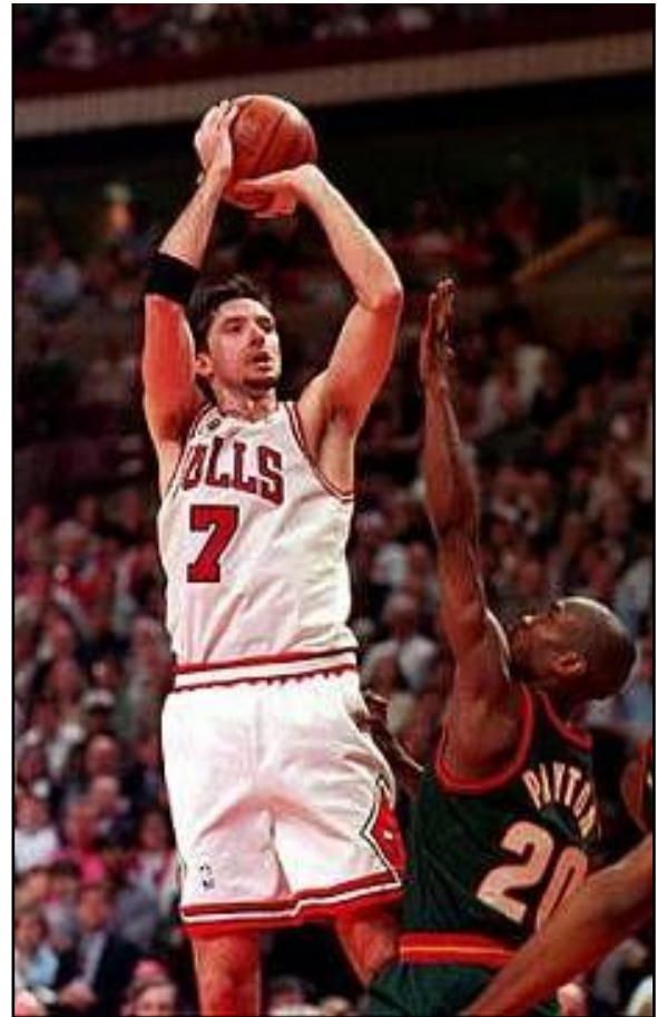
Slika 10: Toni Kukoč u Chicago Bullsima

Nakon svih osvojenih odličja koja imaju hrvatski košarkaši, te nakon njihovog doprinosa europskoj i svjetskoj košarci, javnost se često pita – zašto ih u Hoophallu nema i više? Primarno pod time misleći na Tonija Kukoča koji je pet puta bio spominjan kao potencijalan član, ali na kraju to nikada nije postao. U svojoj karijeri osvojio je europske naslove u klupskoj (Jugoplastika/POP 84) i u reprezentativnoj košarci (Jugoslavija i Hrvatska), naslov svjetskog prvaka s reprezentacijom, dvije olimpijske medalje te naslove prvaka NBA profesionalne košarkaške lige s Chicago Bullsima. Zbog elegantne igre i domišljatosti na parketu dobio je nadimak „Pink panter“. Postao je član FIBA-ine Kuće slavnih u Ženevi, ali još uvijek ne one američke.