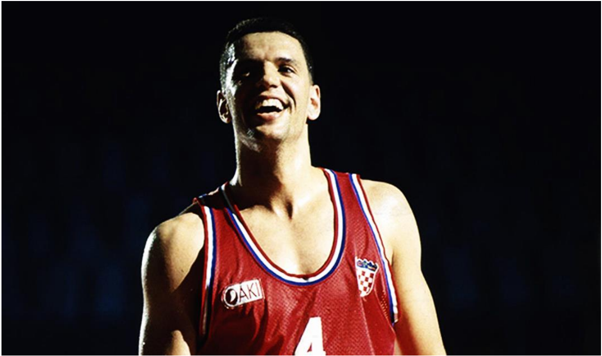
Slika 1. Dražen Petrović

U čast 95 godina košarkaške igre na ovim prostorima.