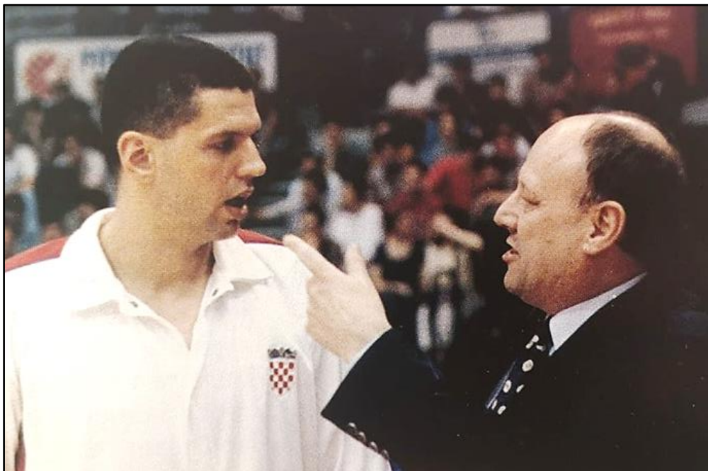
Slika 9: Dražen Petrović i Mirko Novosel

Mirko Novosel uvršten je 2007. u Hall of fame među najbolje trenere ikada. Bio je prvo igrač, a zatim i trener Lokomotive Zagreb. Godine 1973. vodi seniore Jugoslavije do zlatne europske medalje, a taj uspjeh ponavlja i dvije godine nakon, dok 1976. osvaja srebrnu olimpijsku medalju. Zlatnu kolajnu s s OI osvaja 1984. godine. Osvojio je sedam kupova Jugoslavije s Cibonom, a 1985. proglašen je i europskim trenerom godine. Bio je direktor hrvatske reprezentacije, a 1993. posljednji je put bio izbornik hrvatske košarkaške reprezentacije s kojom je tada na EP osvojio broncu (isto).