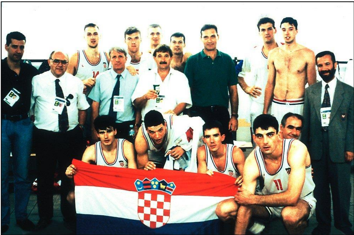
Slika 3: Hrvatska reprezentacija 1992. godine

Suci: Richard Steeves (Kanada) i Wieslaw Zych (Poljska)