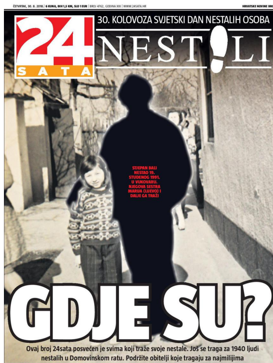
Slika 3 Naslovnica 24sata 30. kolovoza 2018. posvećena obiteljima nestalih