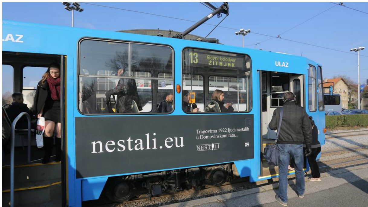
Slika 1 Zagreb: Plakati i posterii posvećeni nestalima u Domovinskom ratu