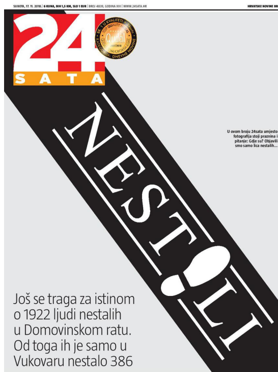
Slika 2 Naslovnica 24sata 17. studenoga 2018. posvećena obiteljima nestalih

Novinama bez fotografija željeli su pokazati prazninu koju više od četvrt stoljeća osjećaju obitelji koje ni danas ne znaju gdje su im njihovi najmiliji.