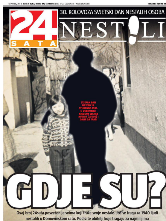
Slika 3 Naslovnica 24sata 30. kolovoza 2018. posvećena obiteljima nestalih