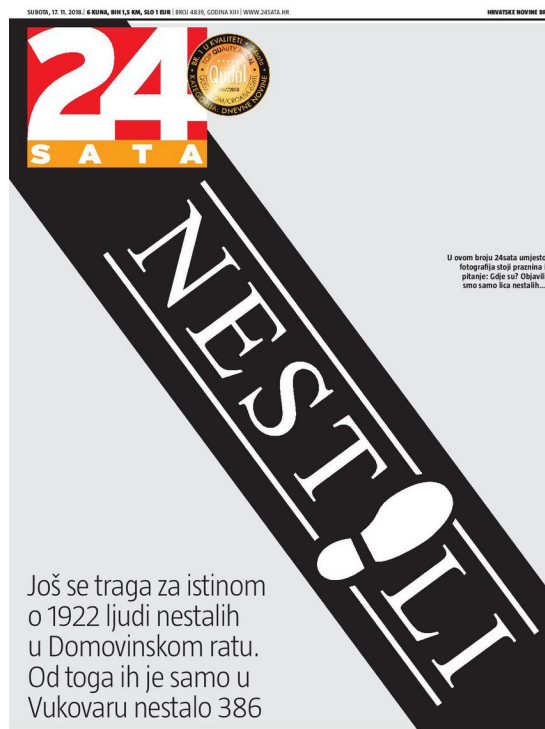
Slika 2 Naslovnica 24sata 17. studenoga 2018. posvećena obiteljima nestalih

Novinama bez fotografija željeli su pokazati prazninu koju više od četvrt stoljeća osjećaju obitelji koje ni danas ne znaju gdje su im njihovi najmiliji.